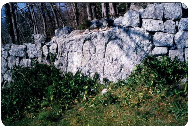
Isola d'Ischia - Pietre della Falanga

alle quali sono legate delle leggende. Dalla lettura di questi racconti si potrebbe desumere che la zona sia stata utilizzata come luogo di culto. L'officiante del rito evocava uno degli spiriti del monte, battendo con i palmi delle mani la pietra percziata. Ne scaturiva una melodia e da un'altra pietra, la "pietra martone", veniva fuori un enorme serpente dalle sette teste 13 , che, ormai incantato e sotto-